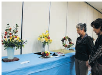
市民文化祭 手工芸展