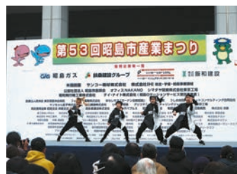
産業まつり ステージ