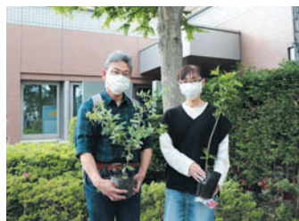
環境緑花フェスティバル