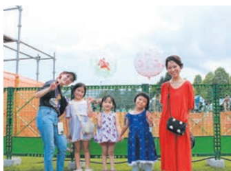
昭島市民くじら祭