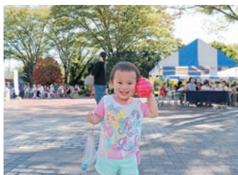
いきいき健康フェスティバル