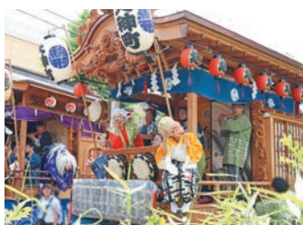
あきしま郷土芸能まつり