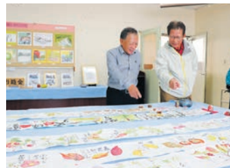
市民文化祭 美術展