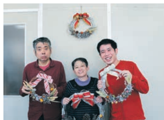
あきしま福祉作業所