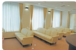
キレイで落ち着いた待合室です♪