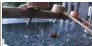
▲ロング部門 最優秀賞作品