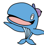
昭島市公式キャラクター アッキー

ウイルスが約100万個いたとして、石けんやハンドソープで10秒もみ洗い後に流水で15秒すすぐと、数十個までウイルスが減ります。それを2回繰り返すと、さらに数個にまで減るんだって！