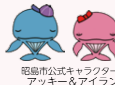
昭島市公式キャラクター アッキー&アイラン