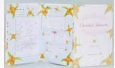
▲オリジナル婚姻届と専用ファイル