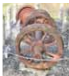
衝突事故車両の車輪▶

「昭島の鉄道先駆者」、「伝えたい! 八高線大列車衝突事故」をテーマに、近代史調査員が講演します。 ◇日時 8月28日(日)の午後1時30分～3時30分 ◇場所 アキシマエンシス国際交流教養文化棟 ◇定員 50人(多数抽選) ◇申し込み 往復はがきに「8月28日講演会」と、住所・氏名・電話番号を記入し、8月15日(必着)までに〒196-0012 つつじが丘3-3-15 アキシマエンシス郷土資料室へ(返信面にも住所・氏名を記入) ☆詳しくは、市民図書館 ☎543-1523へ。