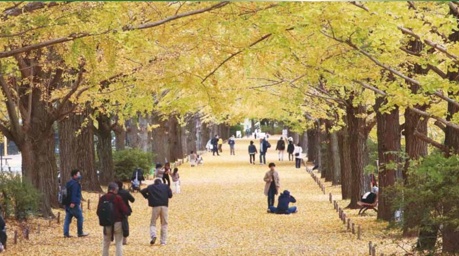
黄金のじゅうたんの上で