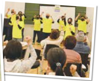
▲くじらの学校運動プログラム