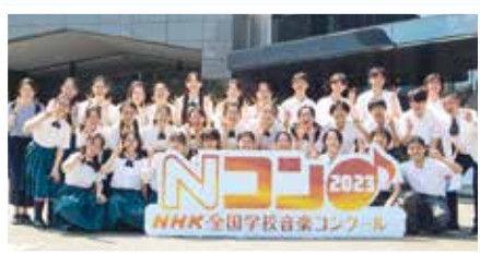
▲創価高校 翼コーラス部