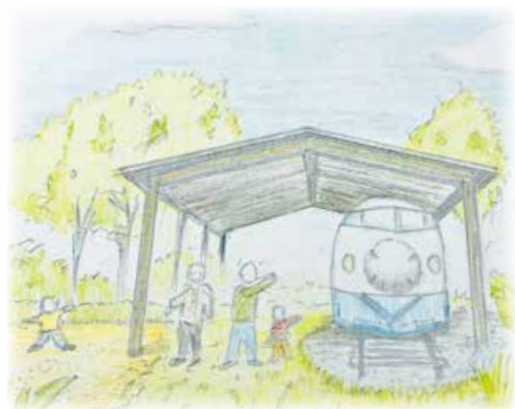
▲改修後のイメージ図

新幹線車両内部については、市民の皆さんに喜んでいただける利活用方法を検討していきます。新幹線車両を市の貴重な財産として未来へ残していくため、ご協力をお願いします。☆詳しくは、企画政策課へ。