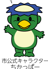
市公式キャラクター ちかっぴー

所得とは、収入から必要経費を差し引いた額です。 サラリーマンなどの給与所得者は、必要経費の特定が難しいため、収入に応じて定められた必要経費を用いて所得を算定します。