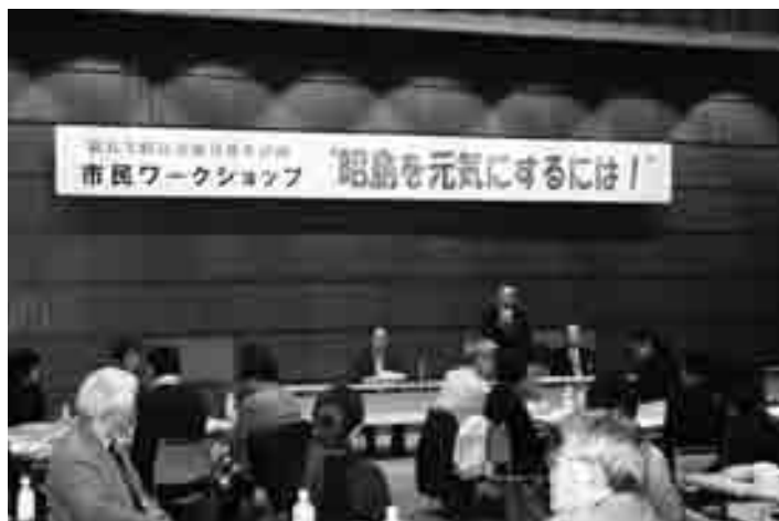
総合基本計画策定市民ワークショップ