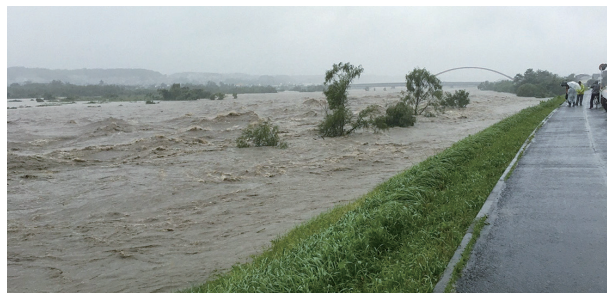
令和元年東日本台風が襲来した際の多摩川の様子

令和元年10月12～13日に超大型台風が襲来し、多摩川氾濫の危険性が増したため、「警戒レベル4」避難勧告（現在の避難指示）を発令しました。昭島市では小・中学校や市立会館等26箇所を避難所として開放し、423世帯1,137名が一時避難されました。昭島市において、人的被害や浸水被害はありませんでしたが、近年、台風が大型化しており、今後も同様な事象が起きるおそれがあります。