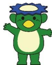
昭島市公式 キャラクター ちかっぱー