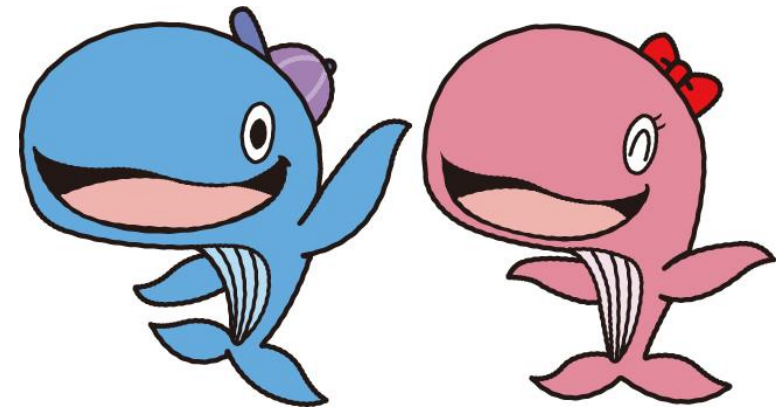
昭島市公式キャラクター アッキー&アイラン