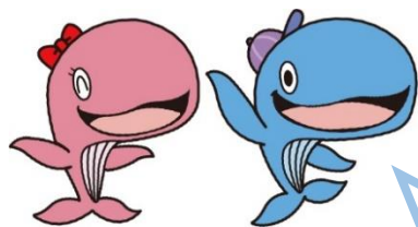
昭島市公式キャラクター アッキー&アイラン