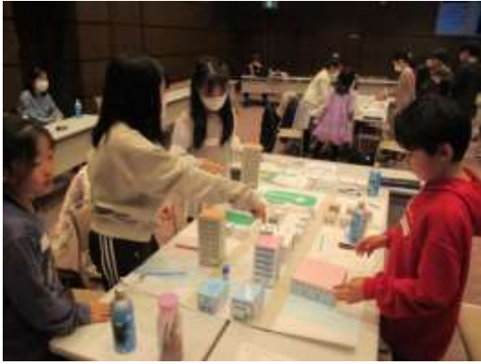
テーマをもとに、みんなでまちづくり