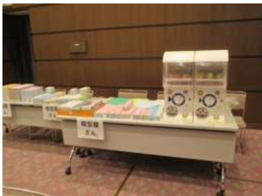
模型屋さん、「まちくじ」ブース