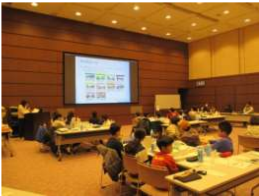
都市計画のルール of 解説