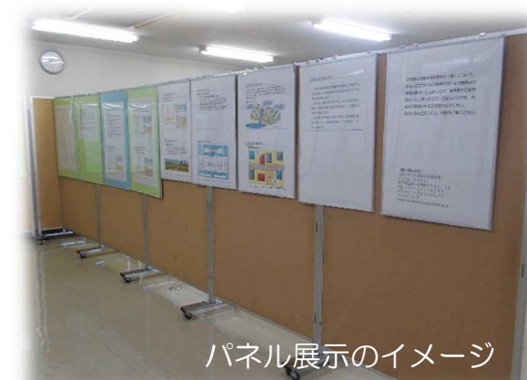
パネル展示のイメージ