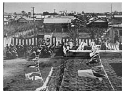
↑ 東部配水場起工式(昭和29年)