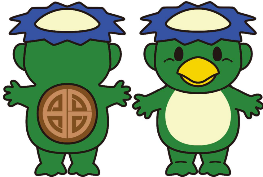
昭島市公式キャラクター ちかっばー

令和6年度版 あきしま学びガイド 編集・発行 昭島市教育委員会 生涯学習部社会教育課 〒196-8511 昭島市田中町 1-17-1 / 電話 042-544-5111 (内) 2252