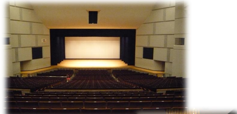
写真上から 大ホール舞台 ホワイエ 大ホール客席